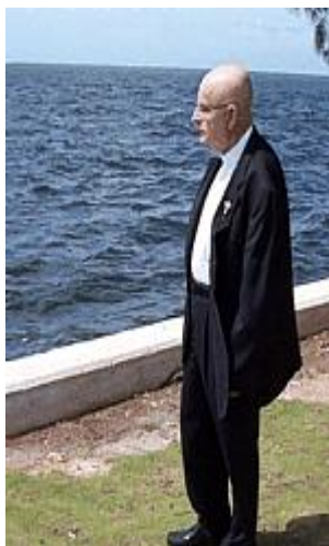
«Yo, salí de Cuba, Cuba no salió de mí.»

Mi primer ministerio en la Parroquia de San Juan el Apóstol en Hialeah, me puso en contacto directo con los jóvenes cubanos que, habiendo tratado de incorporarse a la Sociedad Anglo y no sintiéndose acogidos, afirmaban su identidad hablando en castellano con un acento marcadamente cubano, delicioso a mis oídos. Publico 17 diferentes folletos catequéticos en la Editorial Claretiana de Chicago, que son distribuidos nacionalmente. En 1979 gano el Premio Nacional de Mejor Editorial con la publicación de 6 historietas en el periódico La Voz de la Arquidiócesis de Miami bajo el título “Estampas del Exilio”. En 1979, viendo la necesidad de reafirmar la identidad cubana de las nuevas generaciones, publico 6 folletos bilingües bajo el título “Raíces Cubanas”. Desde 1977 me veo involucrado en varios programas religiosos de radio y televisión en la comunidad. Durante 9 años produje, dirigí y participé en una serie de programas dominicales para el Canal 51, con la participación de niños y el título “Raíces Cubanas”. Desde 1985 celebro la Santa Misa para la televisión en Telemundo. Al mismo tiempo he ejercido mi ministerio sacerdotal en las parroquias de San Kevin, San Brendam, Nuestra Señora de la Divina Providencia y he sido capellán de la Universidad Internacional de La Florida (FIU). Me encuentro en la Ermita de la Caridad desde 1992.