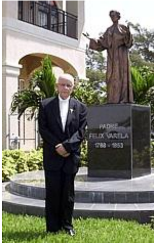
Ante la estatua del Padre Varela.

hablando se entienden” ; “mi familia” y, en el presente, se da a entender en el uso frecuente de expresiones tales como: papito, mamita, papo, mami, mi cielo, mi corazón, mi amorcito, mi socio, mi hermano, etc. La presencia materna de la Virgen de la Caridad marca para el presente y futuro lo mejor del cubano, lo mejor de la nación cubana, el signo por excelencia de comunión.